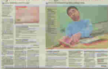
Faksimile av mandagens oppslag i Aftenposten.